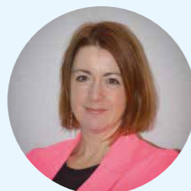
Martine Stouten Stout Groep